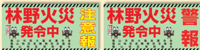
発令時車両に貼るシート